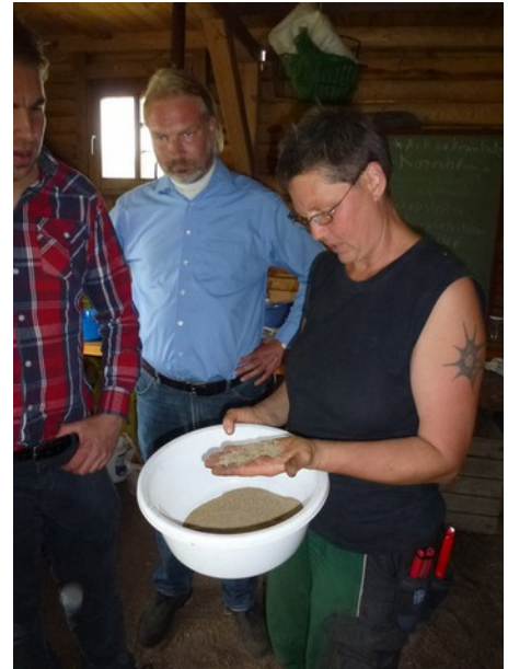
Mitarbeiter des KTBL informieren sich über die Saatgutarbeit bei Keimzelle

Inzwischen engagieren sich in diesem Netzwerk 16 Betriebe, von denen einige Saatgut vermehren, einige Sortenraritäten zur Vermarktung anbauen und einige beides tun. Im vierten Projektjahr einigten sich die Netzwerkmitglieder auf einen Namen, der sowohl die Aktivitäten als auch den regionalen Schwerpunkt zum Ausdruck bringt: SaatGut-Erhalter-Netzwerk-Ost . Seit dem Sommer 2016 verfügt das SaatGut-Erhalter-Netzwerk-Ost über eine eigene website: http://www.saatgut-netzwerk.net/ .