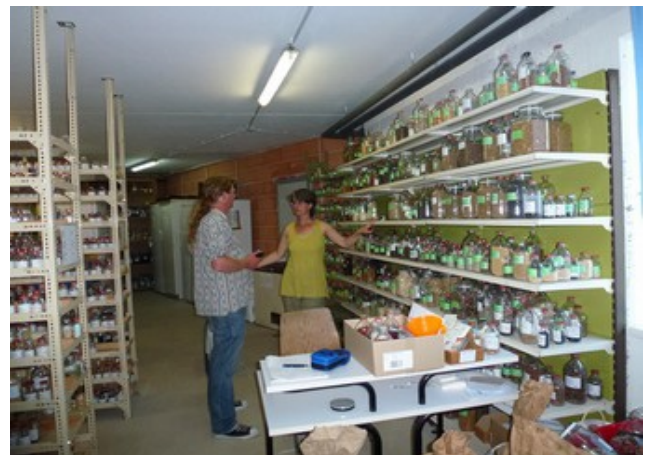
Besuch im Samenarchiv von Arche Noah

Zusätzlich besuchten VERN e.V. und die Humboldt-Universität andere Saatgutinitiativen wie die Arche Noah in Österreich oder den Samengarten in Eichstätten am Kaiserstuhl, Züchter von Dreschflegel und Kultursaat e. V., sowie Saatgutunternehmen wie die Bingenheimer Saatgut AG, ReinSaat und Sativa für einen Informationsaustausch und um fachlichen Rat und Hinweise für eine gute fachliche Praxis in der Sortenerhaltung einzuholen.