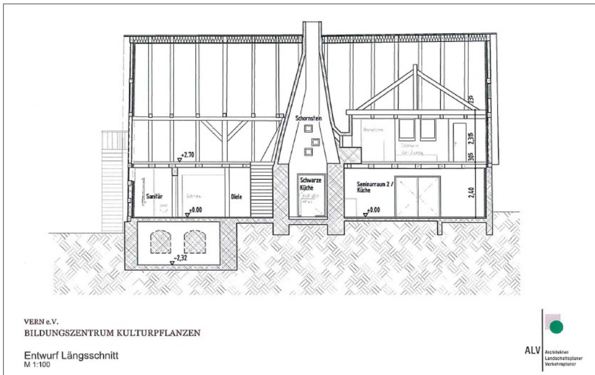
Längsschnitt – VERN Seminarhaus mit Schwarzer Küche (Erdgeschoss mit Küche, Seminarräumen und barrierefreier Sanitäreinrichtung; obere Etage mit Saatgutwerkstatt, Labor und Ausstellungsräumen).

Der Plan zur Sanierung des denkmalgeschützten Hauses stellt die historische „Schwarze Küche“ als Kulturdenkmal in den Mittelpunkt, um die herum die Funktionsräume angeordnet werden. Das Haus wird zweistöckig ausgebaut sein und es wird im Erdgeschoß über einen Seminarraum und eine Küche, die auch für Workshops geeignet ist, verfügen. Im Dachgeschoß werden eine Saatgutwerkstatt und Ausstellungsräume untergebracht. Wir sind mit den Entwürfen sehr glücklich.