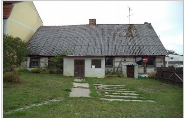
Zustand des Hauses Burgstraße 21 (links Straßen- und Seitenansicht, rechts Ansicht vom Garten) bis Ende April 2017.

Der Plan zur Sanierung des denkmalgeschützten Hauses stellt die historische „Schwarze Küche“ als Kulturdenkmal in den Mittelpunkt, um die herum die Funktionsräume angeordnet werden. Das Haus wird zweistöckig ausgebaut sein und es wird im Erdgeschoß über einen Seminarraum und eine Küche, die auch für Workshops geeignet ist, verfügen. Im Dachgeschoß werden eine Saatgutwerkstatt und Ausstellungsräume untergebracht. Wir sind mit den Entwürfen sehr glücklich.