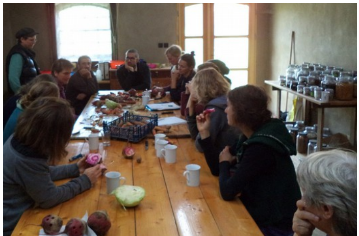
Workshop zur Selektion auf Geschmack

Die Ergebnisse wurden in einer „Auswahlliste alter Gemüsesorten mit geprüfter Anbau- und Vermarktungseignung zur On-farm Nutzung“ zusammengestellt. 26 der alten Sorten zeigten sich geeignet, wieder gärtnerisch genutzt und damit „on-farm“ – im gärtnerischen oder bäuerlichen Betrieb erhalten zu werden.