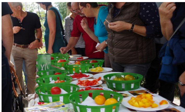
Tomatenverkostung auf dem Sommerfest des VERN 2016 in Greiffenberg